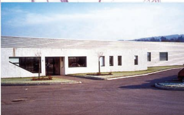
Extrusion soufflage 01 Ambronnay 3000m 2