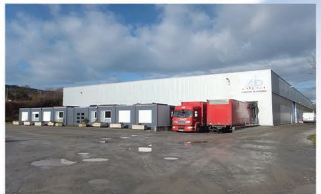
Injection soufflage 74 La Roche s/ Foron 3000m 2

160, rue des Vergers -ZI Les Dragiez- BP 80059 74802 La Roche Sur Foron Cedex- FRANCE Tél: 0033 (4) 50 25 67 20 Fax: (0)4 50 25 26 09 www.alpafrance.fr